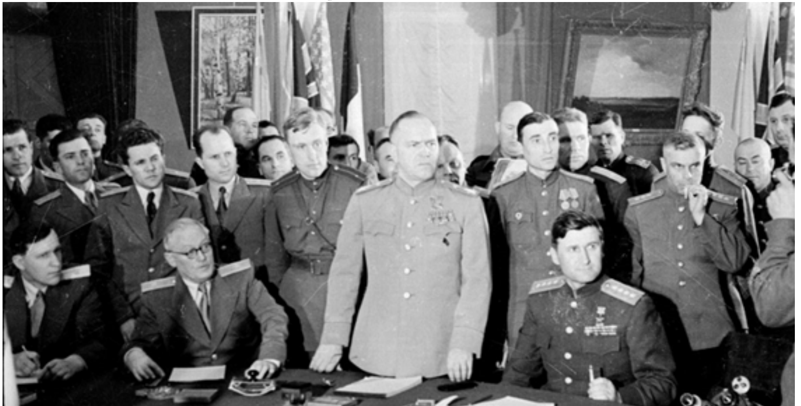
Alto mando del ejercito sovietico, liderado por el Mariscal, Gueorgui Zhúkov.

Cuando el reloj marcaba las 22:43 del 8 de mayo de 1945 (00:43 del 9 de mayo en Moscú), el mariscal Wilhelm Keitel firmó en Karlshorst la capitulación incondicional de la Alemania nazi ante el Alto Mando soviético. Este acto, realizado en la sede del Ejército Rojo en Berlín, no fue una mera formalidad: fue la certificación histórica de que la URSS había sido el verdadero artífice de la derrota del fascismo.